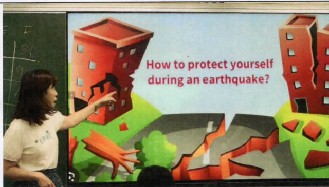
老師介紹今天上課內容