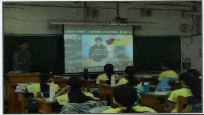
聆聽各國警報聲，發揮想像力