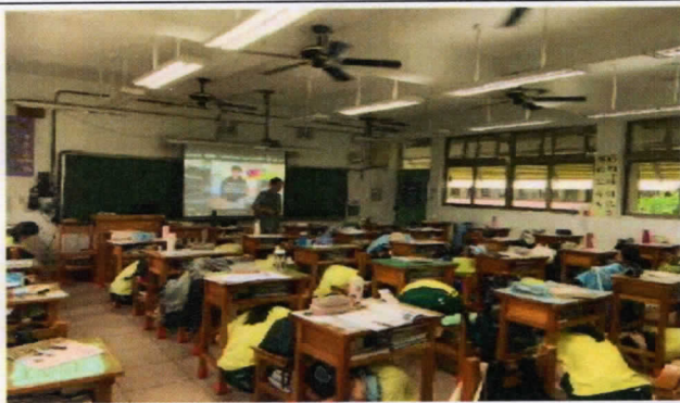
班級無預警的防災演練