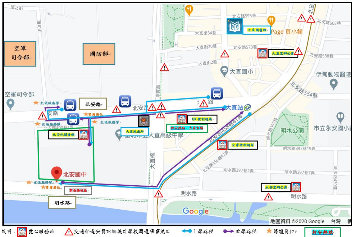
臺北市立北安國民中學校安熱點暨社區交通安全地圖