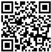
報名網站 QR CODE