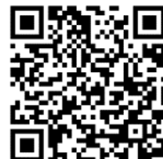
游於藝網站使用說明影片