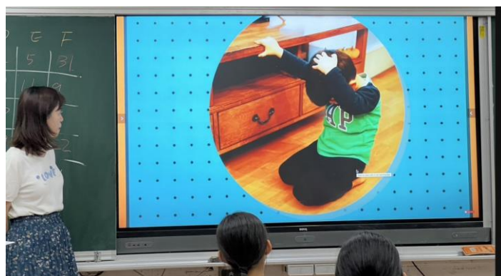
觀看影片：The earthquake plan.