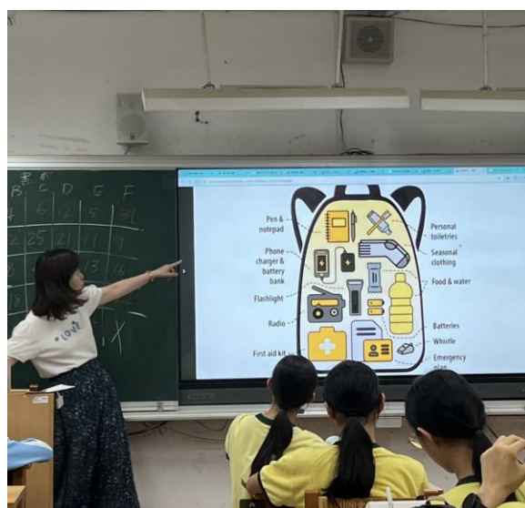
教導學生急難救助包內容