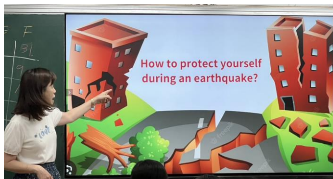
How to protect yourself during an earthquake? 老師介紹今天上課內容